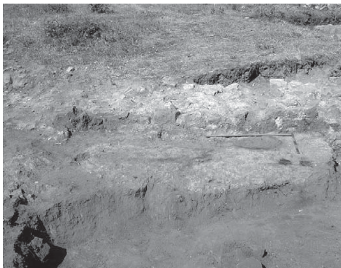
Обр. 7 Сграда № 2, общ изглед