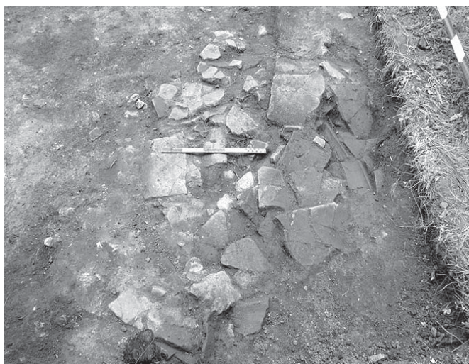
Обр. 5 Сграда № 1, струпване на покривна керамика