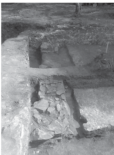
Обр. 3 Сграда № 4, южна стена и югозападен ъгъл