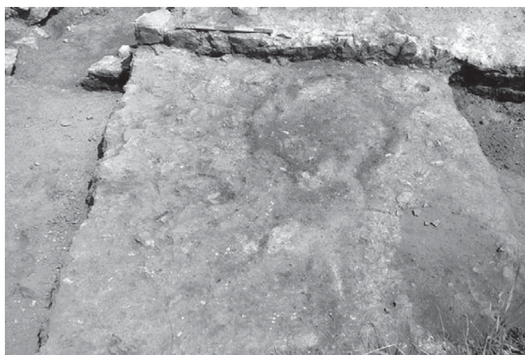
Обр. 6 Сграда № 1 – пещ