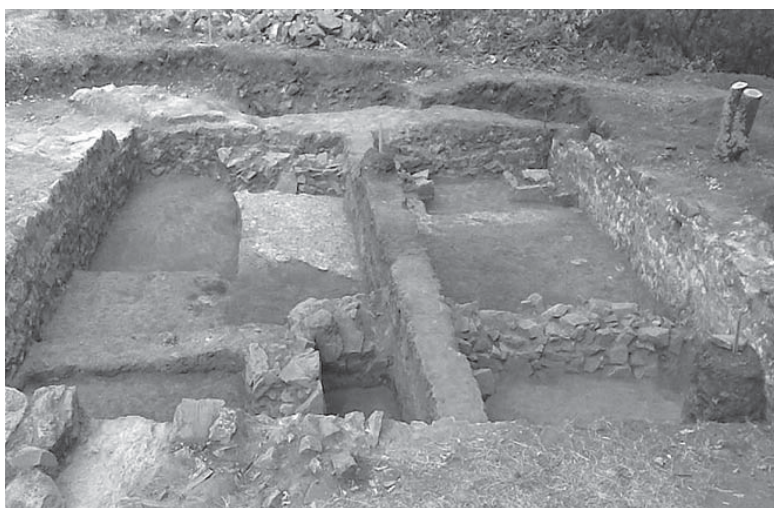
Обр. 2 Кула № III и разкритата под основите ѝ сграда № 3