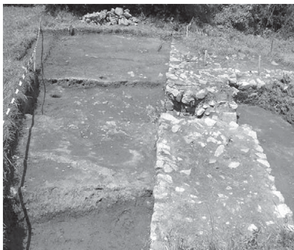
Обр. 4 Сграда № 1, общ изглед