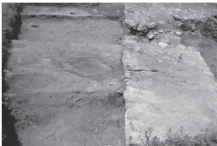
Ил. 3 Жилища с верижен план, долепени до крепостната стена при кула 2 в северозападния ъгъл. На преден план – останки от огнище.