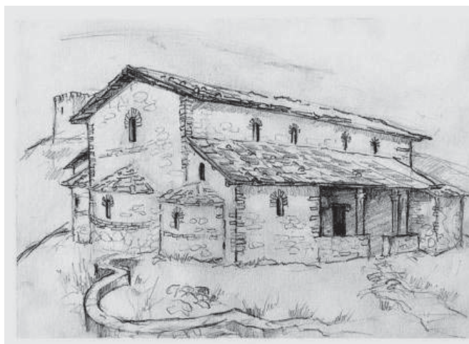
Ил. 5 Графична примерна възстановка на базиликата от V в.

За силната религиозна ангажираност на хълма говори и разкритият християнски култов комплекс. Той е разположен непосредствено северно от портата на крепостта. Около разкопаната през 2007 г. средновековна църква бяха регистрирани и проучени по-ранни архитектурни останки. На този етап можем да обобщим, че средновековният християнски храм е функционирал около XIV-XV в. (ил. 4)