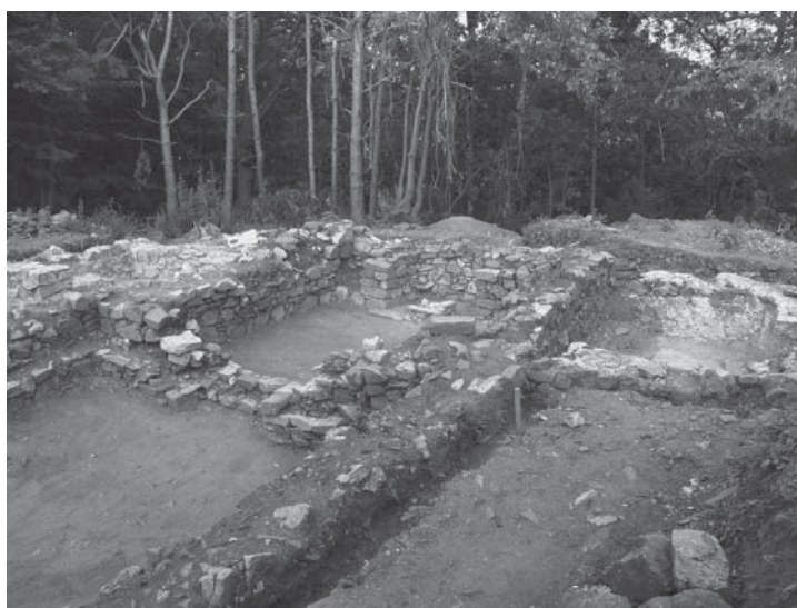
Ил. 4 Сектор 2. Средновековната църква и античните пастофории от север и юг. (Проучвания 2008)