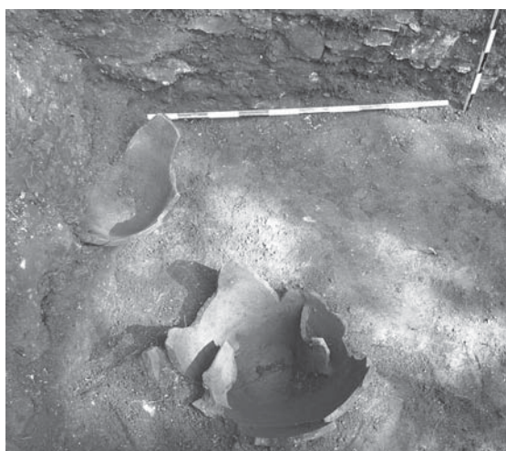
Ил. 2 Вкопани питоси в подовото ниво на кулата.

В рамките на сондажа се разкриха in situ долните части на два средно големи питоса, унищожени при срутването на високо запазени части от съоръжението, и единични фрагменти от устията им, както и фрагмент от сив късноантичен съд, близък по тип с познатите от поповянската група. (ил. 2)