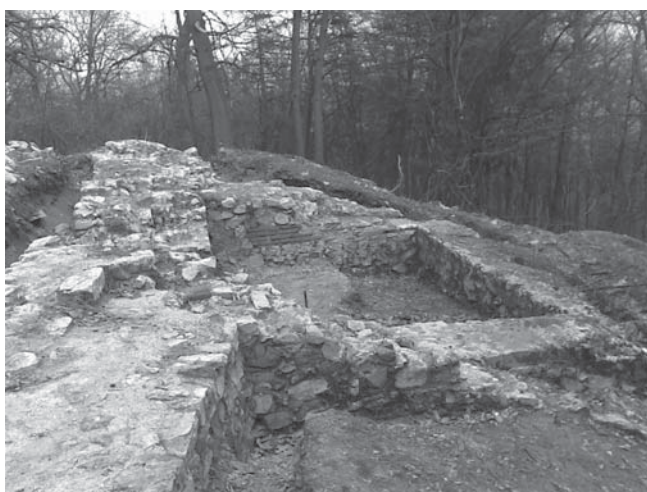
Ил. 1 Кула 1 в югоизточния ъгъл на крепостта.

Крепостната стена затваря площ от 9 дка. (ил. 1) Кулата бе отчетливо видима вследствие на иманярски изкоп. Разкрити бяха зидове, градени от ломени камъни и бял, ронлив и шуплест хоросан. След разчистването на зидовете се установи, че това са два различни зида, долепени на тънка фуга един до друг – т.е. едно вторично удебеляване на стената. 2